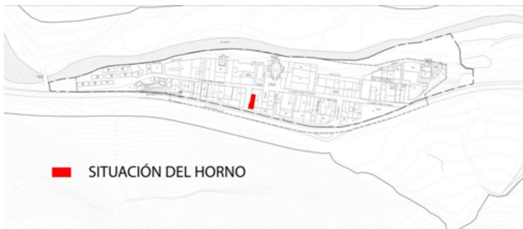
Fig-01 Situación de la edificación