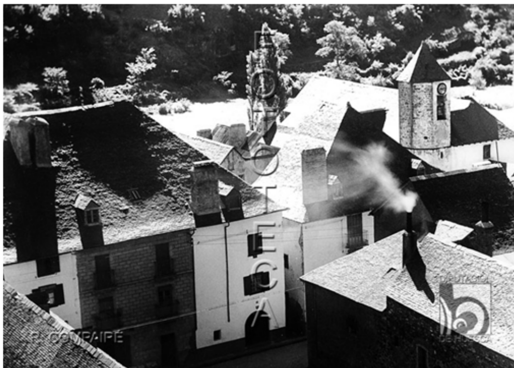
Fig.- 03 Imagen de Canfranc antes del incendio de 1944. En la esquina inferior derecha puede verse el edificio original del Homo, y su altura similar o superior a la de los edificios de la calle Albareda